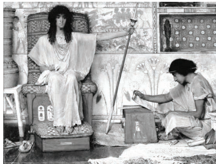
Jozef pred faraónom

V tejto kapitole čítame, ako pre Jozefa nastala veľká chvíľa, kedy ho Boh uznal za zreleho, aby prešiel zo žalára na trón. Stalo sa tak vďaka výkladu snov, ktoré sa prisnili egyptskému faraónovi. Prvý bol o siedmich pekných tučných kravách a o siedmich chatrných kravách, pričom tie chudé zožrali kravy tučné. Druhý sen bol o siedmich tučných klasoch a o siedmich chatrných klasoch, pričom tie chatrné zhlkli tučné. (41,3-7) A nebolo v celom Egypte toho, kto by tie sny vedel vyložiť. Čítame: „ Po dvoch celých rokoch... “ spomenul si čašník, že na Jozefa zabudol. Dva roky nie sú až taký dlhý čas, ale môžu sa stať dlhými, ak človek žije v sebe nádej, že ten, ktorému kedysi pomohol, si spomenie.